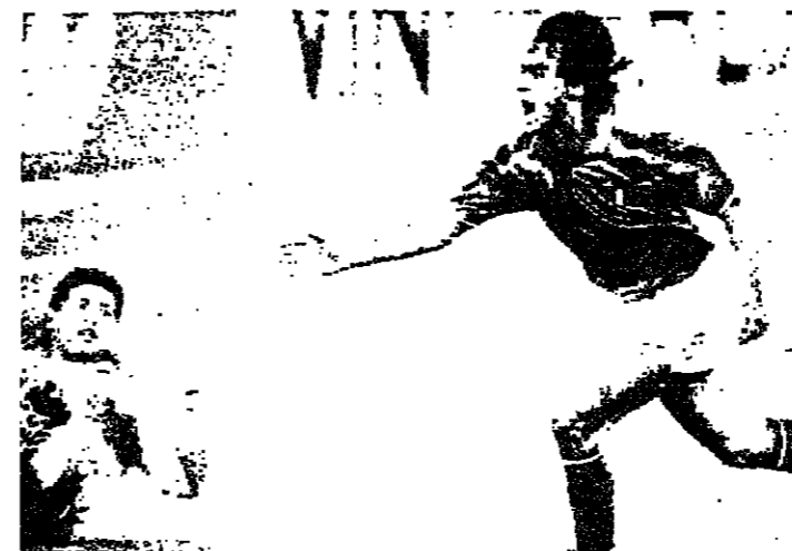
جينيوني فرحا بتسجيله هدف إيطاليا